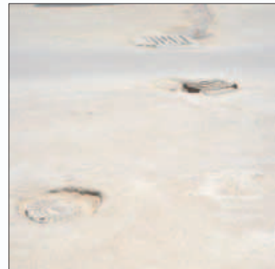
همسطح سازی منتهول ها و آسفالت کف خیابان به می شود. به گفته وی، نزدیک به ۸۰۰ کیلومتر