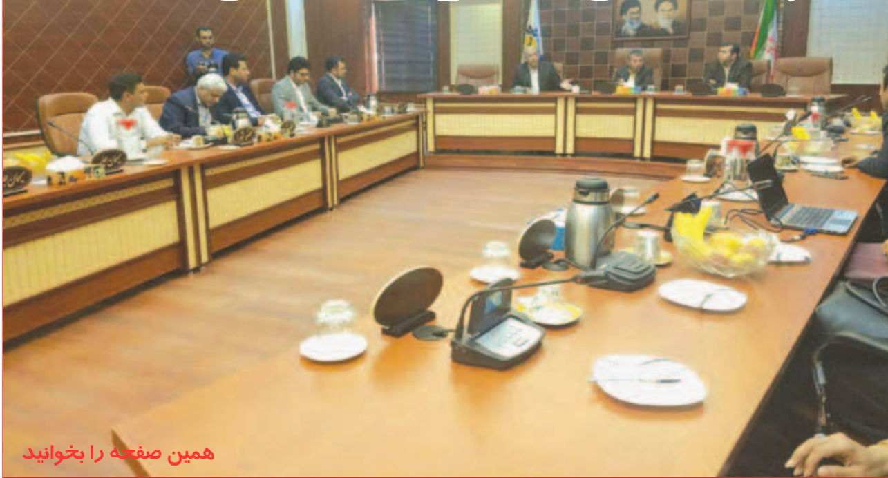
همین صفحه را بخوانید

تجمع جمعی از مهندسين شرکت نفت ستاره خلیج فارس مقابل استانداری