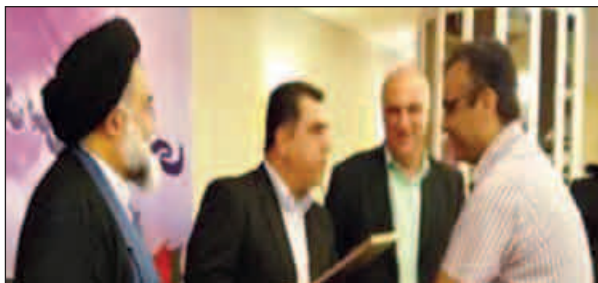
خانواده‌های این عزیزان محقق شده است. وی افزود: اساتید برای ما ارزشمند هستند؛ اگر خدمتی ارائه می‌کنند و منشا خیر و برکت هستند، بی شک در کنار این عزیزان خانواده‌های آنان بودند. گفتنی است در پایان مراسم از اساتید پیشکسوت و نمونه دانشکده‌های دانشگاه علوم پزشکی هرمزگان تقدیر شد.

همزمان با سالگرد شهادت استاد مطهری و بزرگداشت مقام معلم مراسم تجلیل از اساتید دانشگاه علوم پزشکی هرمزگان با حضور دکتر داودی رییس دانشگاه علوم پزشکی هرمزگان، اعضای هیئت رئیسه دانشگاه، اساتید و خانواده‌های آنان برگزار شد. دکتر داودی رییس دانشگاه علوم پزشکی هرمزگان در ابتدای این مراسم ضمن تبریک فرارسیدن اعیاد شعبانیه و روز معلم گفت: اساتید دانشگاه معلمان حوزه آموزش عالی هستند؛ و افتخار بزرگی است که توفیق ارائه خدمت و تربیت نیروهای دانشمند و متخصص برای رشد