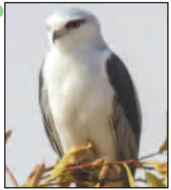
نام انگلیسی: Black-winged Kite نام عربی: الحداة سوداء الكتف نام علمی: ELANUS CAERULEUS