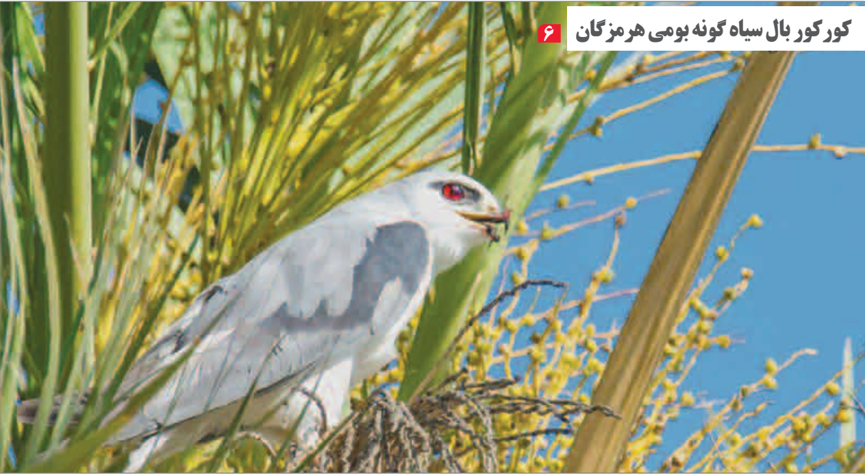
کور کور بال سیاه گونه بومی هرمزگان